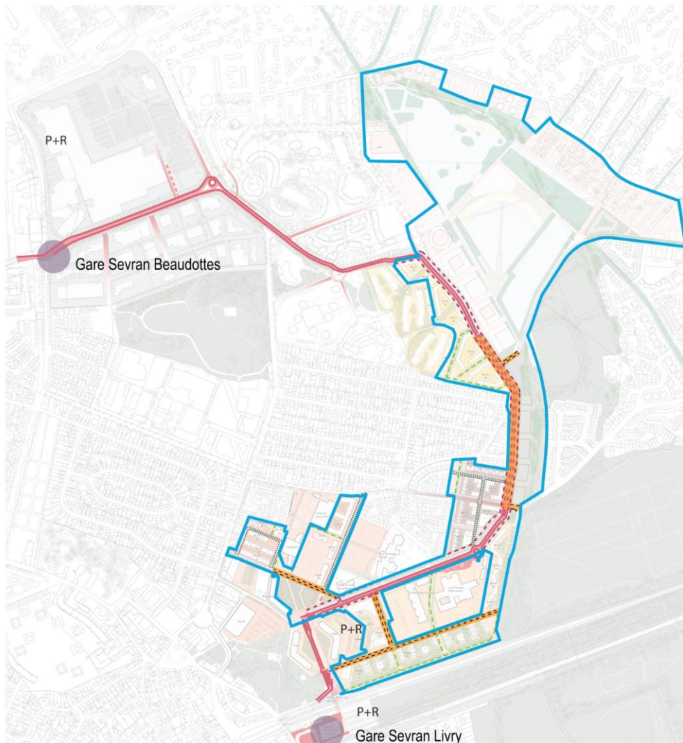
Périmètre de la ZAC Sevrans Terre d'Avenir Centre-ville – Montceaux